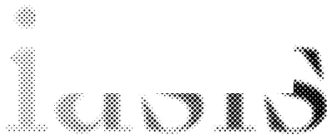
AMKE IASIS, Grecia