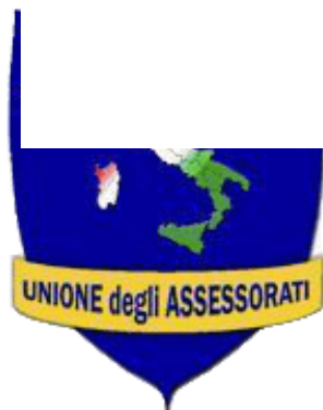
Union degli Assessorati, Ιταλία